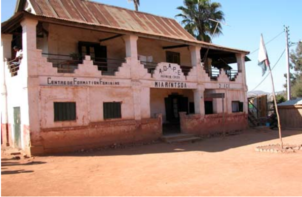
Figure 10 : Association ADAPE (Fianarantsoa)