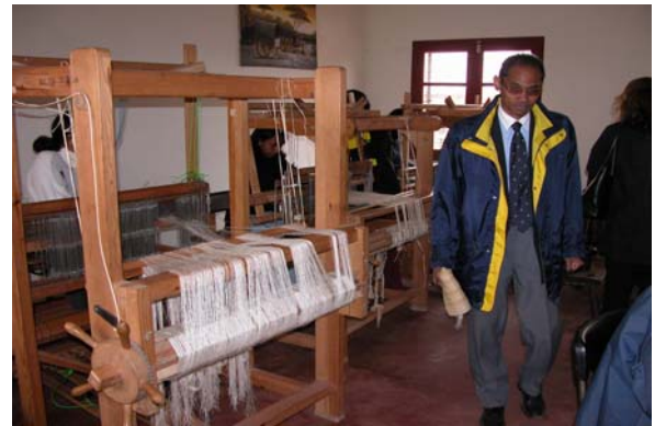
Figure 5 : EMSF – Métiers pour formation