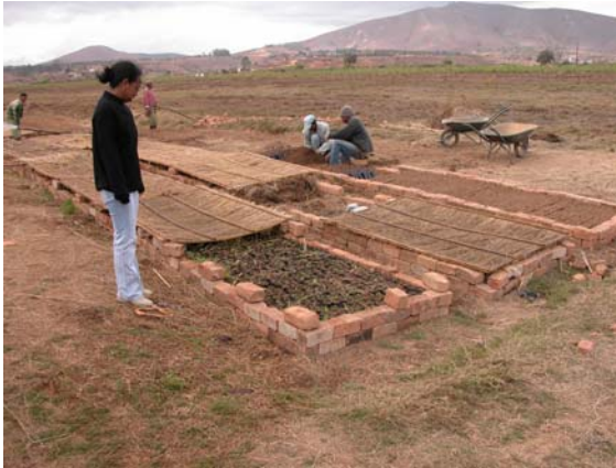
Figure 8 – SIS (Mahitsy) : Essais de nouvelles variétés de mûriers financées par l'ONUDI