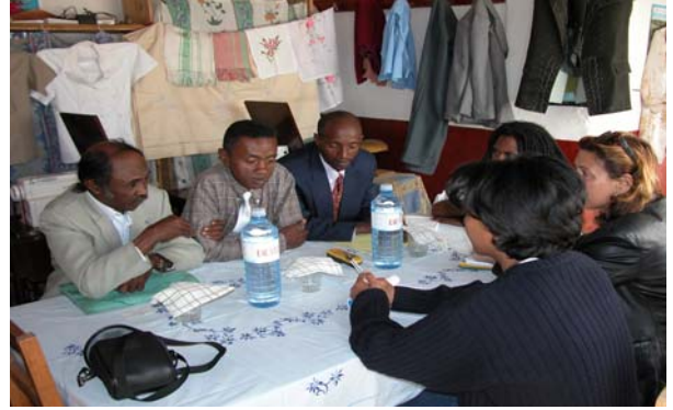
Figure 11 : Association ADAPE (Fianarantsoa) – Artisans formateurs de l’atelier couture bénéficiaire de machines (4) et de formation