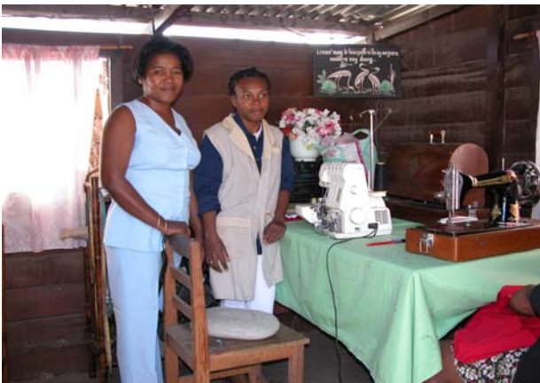
Figure 12 : Création Danny (Toliara) – La propriétaire, une employée et la surjeteuse remise par l’ONUUDI