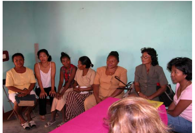
Figure 15 : Réunion à Toliara avec des responsables d’associations bénéficiaires de formation