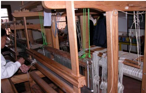
Figure 4 : EMSF – Métiers pour formation