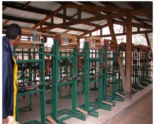
Figure 7 : EMSF – Bassines de filature, moulins et doubleuses-reflotteuses améliorées en attente d’être réparties chez des opérateurs pilotes