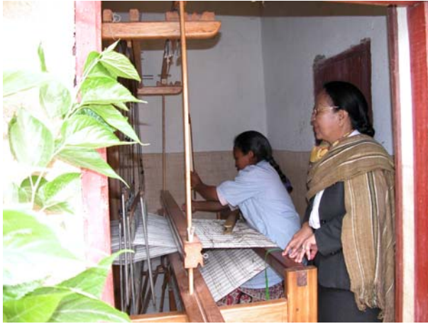
Figure 2 : Manjakalandy -Métier à tisser la soie amélioré