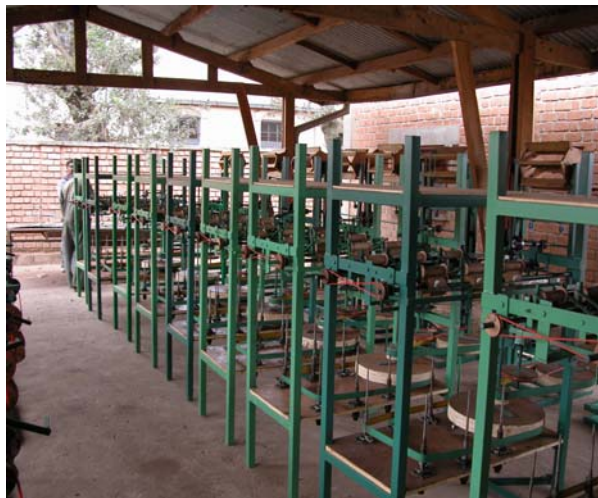
Figure 6 : EMSF – Bassines de filatures, moulins et doubleuses-reflotteuses améliorées en attente d’être réparties chez des opérateurs pilotes