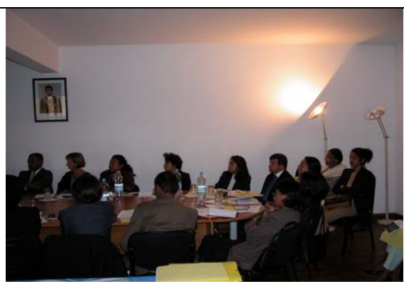
Figure 17 : Réunion de restitution au MICDSP