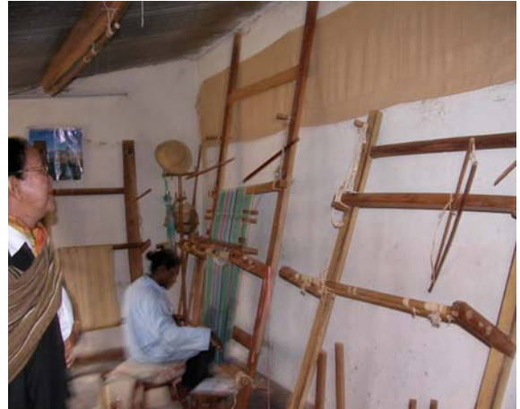
Figure 3 : Manjakalandy - Métiers à tisser traditionnels verticaux