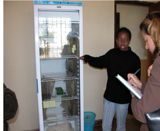
Figure 9 : SIS (Mahitsy) : Réfrigérateur pour graines (œufs de vers à soie) reçu de l'ONUDI