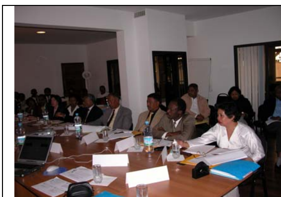
Figure 16 : Réunion de restitution au MICDSP